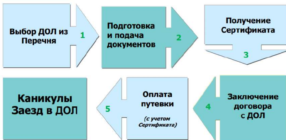
Рисунок 1. Порядок приобретения путевок в ДОЛ в Санкт-Петербурге.

Порядок приобретения путевок в детские оздоровительные лагеря (далее – ДОЛ) для детей работающих граждан представлен на рис. 1.