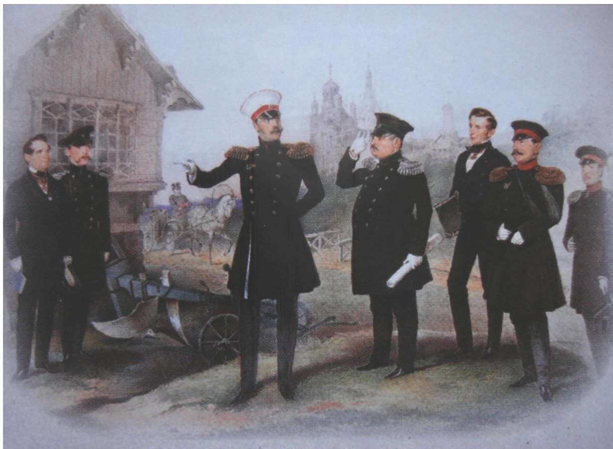
М.Зичи. Гравюра «Николай I на Бибионе» М.Пилсудский, предположительно, изображён вторым с левой стороны

В 1859 году Мечеслав Иванович издал книгу «Петергофские фонтаны» уникальное и непревзойдённое до настоящего времени описание всей водопроводящей системы от истоков у Ропшинских высот до впадения в Финский залив, содержащее и историю фонтанов Петергофа.