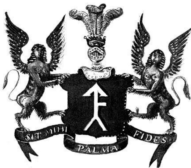
Герб рода Пилсудских

Посетитель РГИА в Санкт-Петербурге имеет редкую возможность познакомиться с гербом рода Пилсудских, его красочным изображением и описанием.