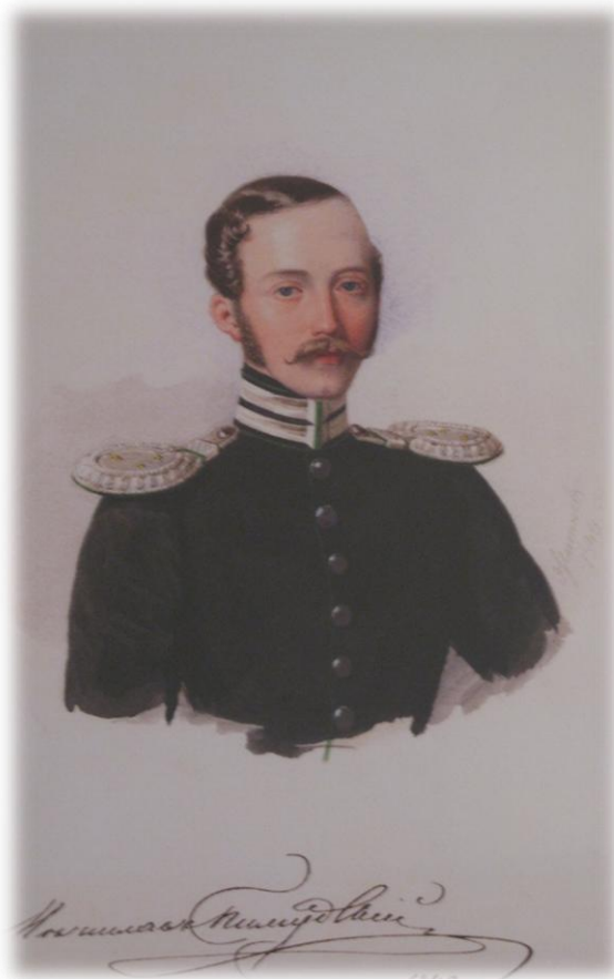
Е.Житнев. Акварельный портрет М.И.Пилсудского. 1849г

Главной заботой Пилсудского была вся водопроводящая фонтанная система, которую он изучил в совершенстве. С 1857 по 1874 гг. он был управляющим петергофскими фонтанами.